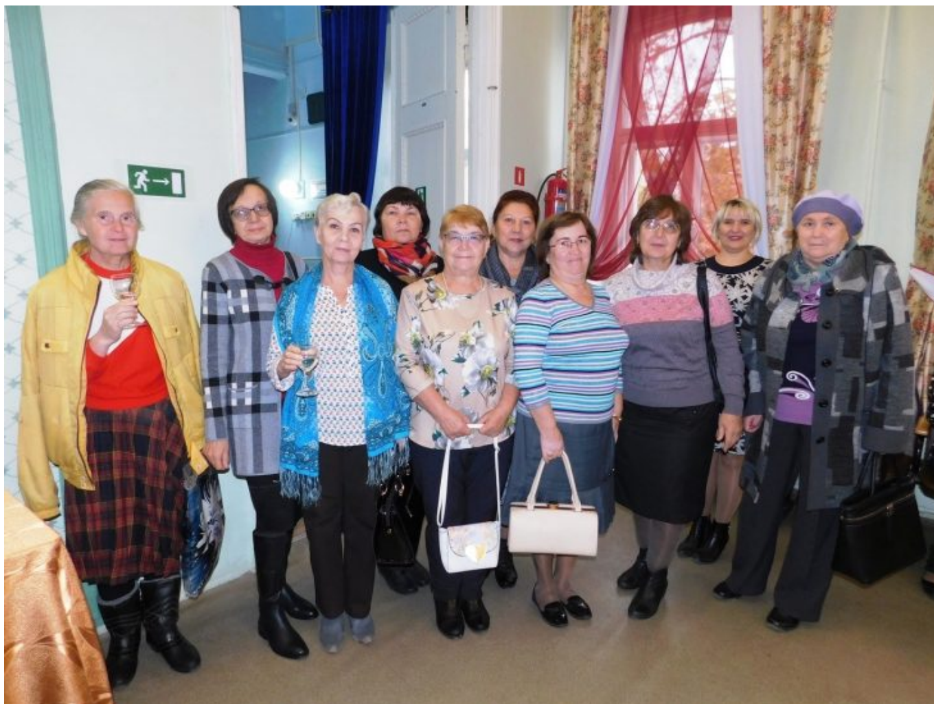
На фото: работники библиотек г.Кунгура, которые вышли на заслуженный отдых