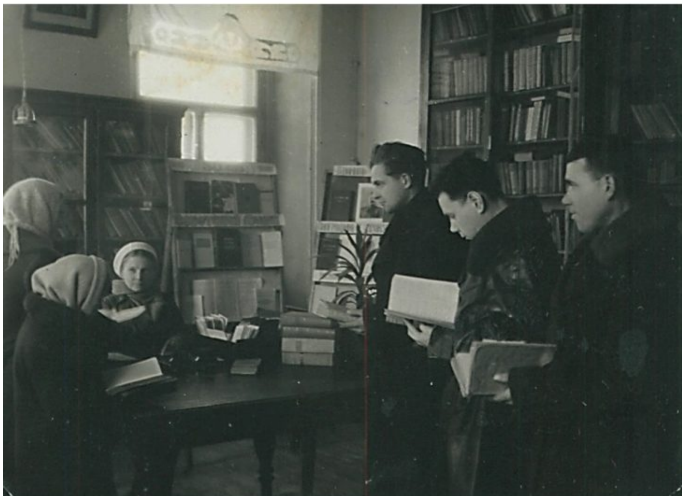
Библиотека в 50-е годы

специалисты из других организаций и предприятий. Отмечается высокая посещаемость лекций (от 50 до 100 человек).