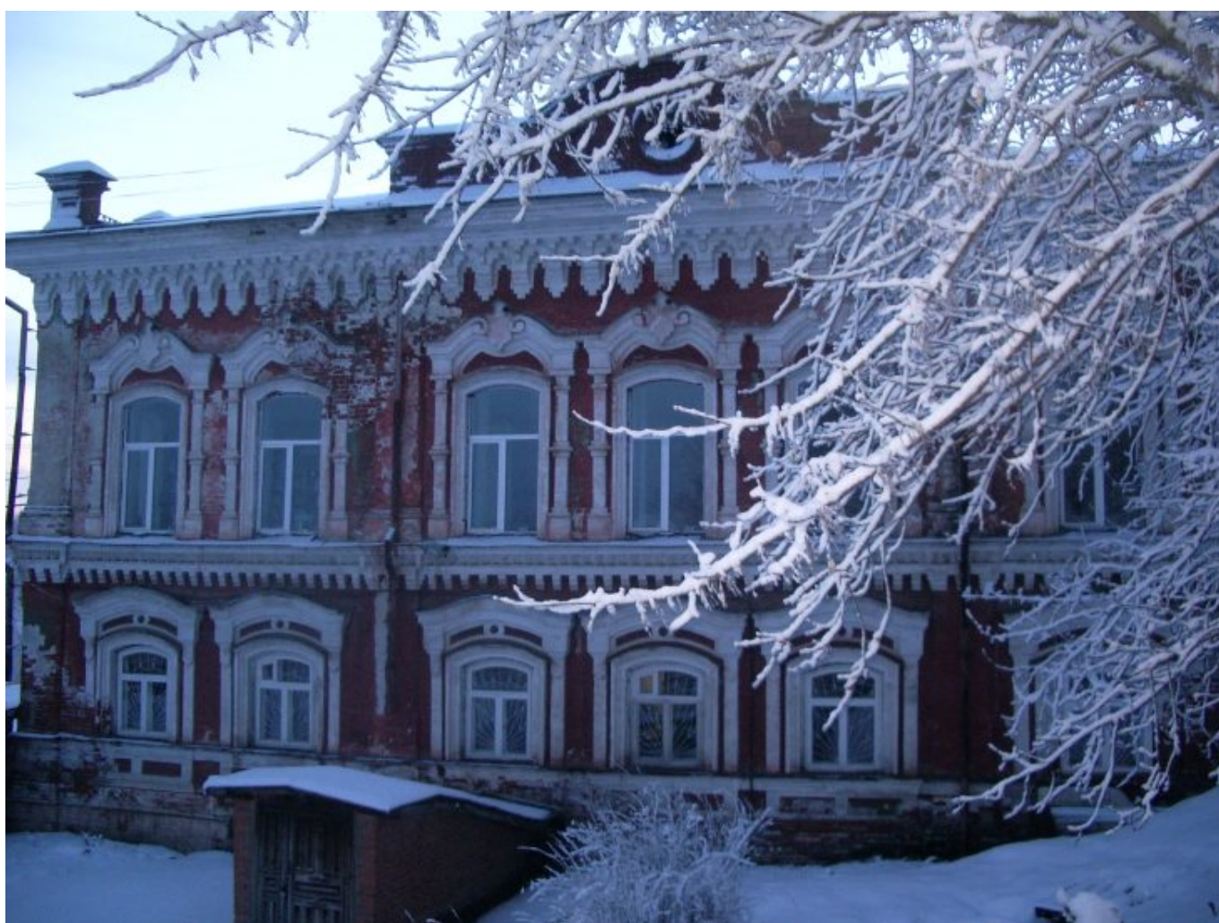
Здание библиотеки. Начало 2000-х гг.

9. Микушева А. Книга идёт в массы / А. Микушева //Искра. – 1967. – 26 января