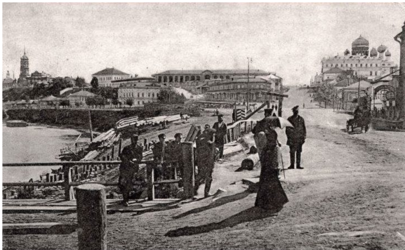
ул. Киттарская, Кунгур