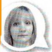
Беседовала Анна ПАНИНА

Издательство «Эксмо» создало своеобразный путеводитель по творчеству писательницы ( https://eksmo.ru/news/2514832/ ), где сгруппированы произведения, выходящие в свет с 1992 по 2016 г. Изучив его, читатели смогут узнать, в какой последовательности нужно знакомиться с публикациями автора.